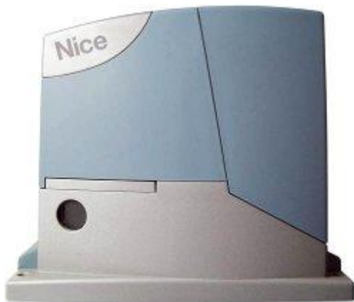
Рис.1 Привод откатного шлагбаума.